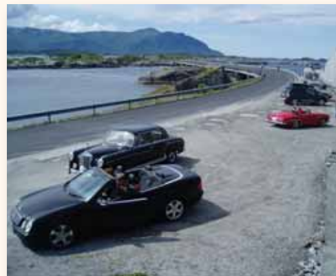
Stjernene har stoppet for å beundre Atlanterhavsveien.

individuell kjøring tilbake på hotellet for bilvask, bilstell, bilprat og øl. Som vanlig