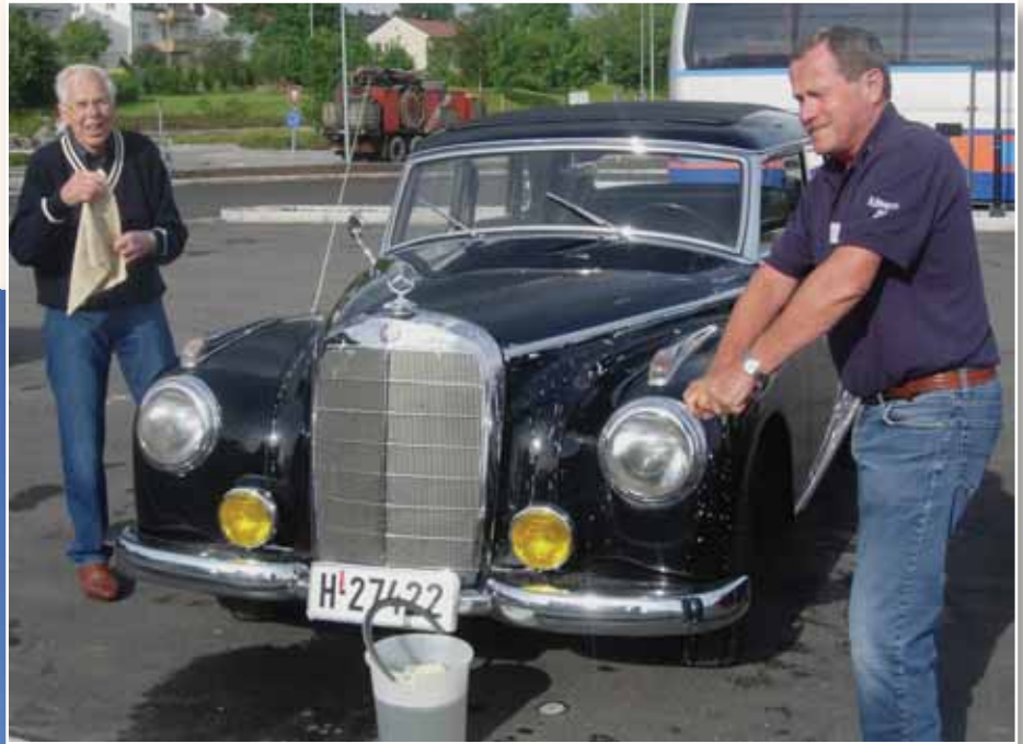
Det første du gjør når du ankommer Stjerneløp er selvfølgelig å vaske bilen.