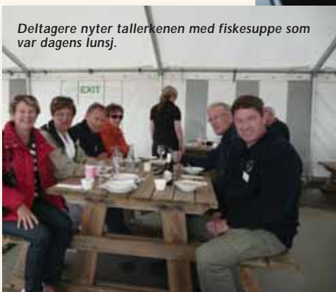
Deltagere nyter tallerkenen med fiskesuppe som var dagens lunsj.