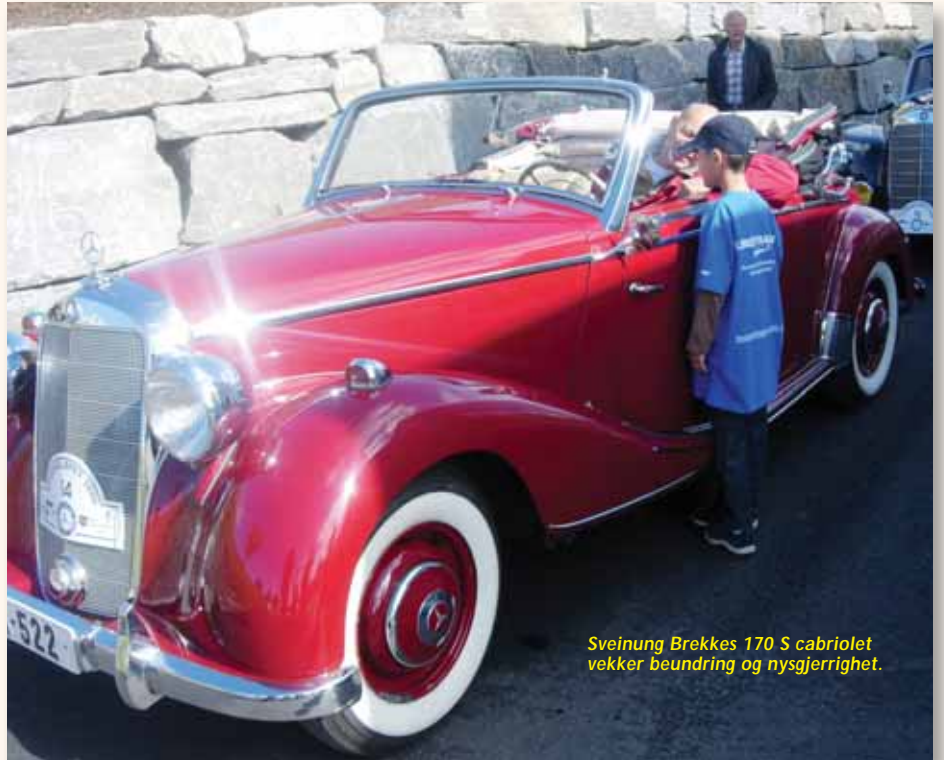
Sveinung Brekkes 170 S cabriolet vekker beundring og nysgjerrighet.

trukket lodd fra den loddboka vi fikk utdelt ved start for hver gang vi gjorde feil.