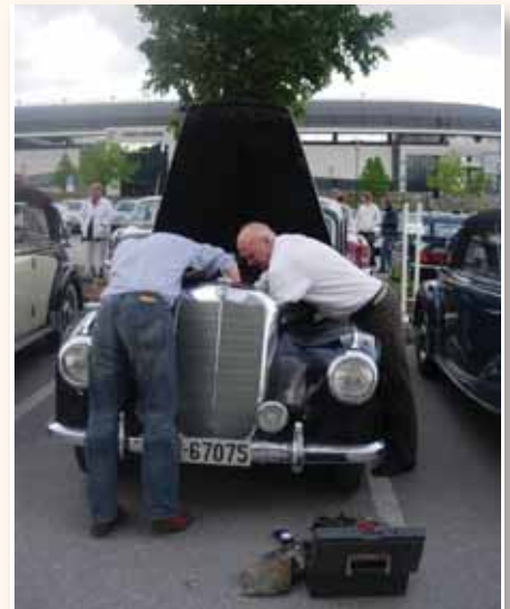
Myklebust karene fra Vartdal skrudde hele kvelden på ei vannpumpe som hadde sprunget lekk. Dessverre lakk reservepumpa også.

Det var etter hvert flere som sluttet seg til og det ble en fin tur i sol og fint vær. I Molde var det mottakelse i kjent stil, med Trondheimsavdelingens