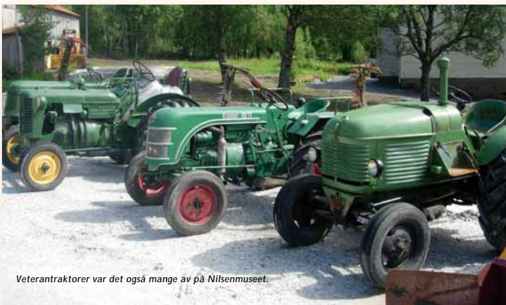
Veterantraktorer var det også mange av på Nilsenmuseet.

bilene uten for mye venting. Noe venting ble det, men i det fine været var det jo bare og slå av en prat med andre Mercedes venner.