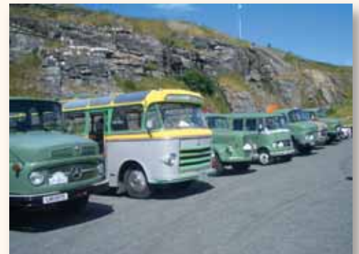
Nyttekjøretøyene samlet ved Bud der det var lunsj. Dette var også slutten på selve løpet.