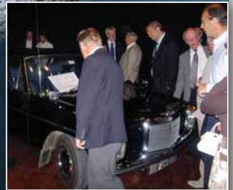
Denne strek 8'en som var satt inn i middagsalen markerte at modellen er 40 år i år. Den vakte som man ser stor interesse. (Se nærmere omtale i teksten.)