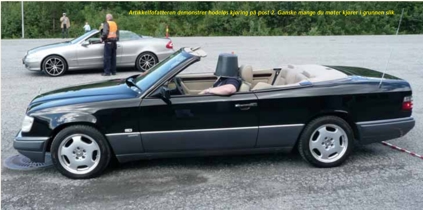
Artikkelffatteren demonstrer hodeløs kjøring på post 2. Ganske mange du møter kjører i grunnen slik.