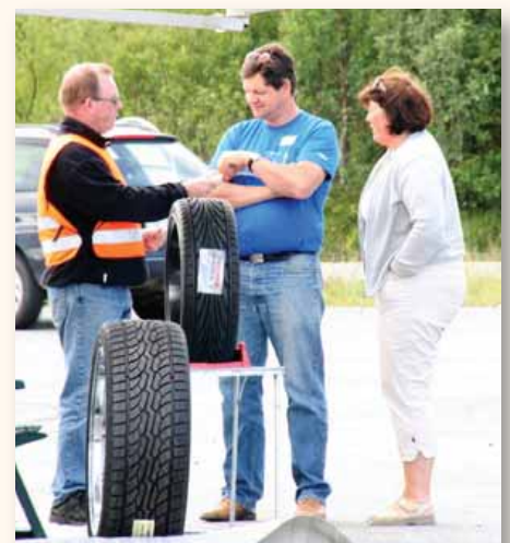
På denne posten skulle vi gjette vekten av ulike dekk med felg. Her er det Presidenten som avgir sitt tips