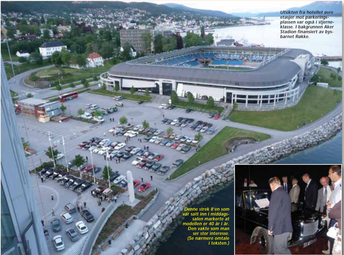
Utsikten fra hotellet øvre etasjer mot parkeringsplassen var også i stjerneklasse. I bakgrunnen Aker Stadion finansiert av bysbarnet Røkke.