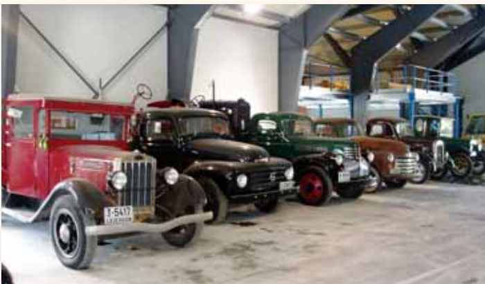
Rad med lastebiler på Nilsenmuseet. Nr 2 fra høyre er faktisk en MB som blir omtalt i et senere nummer.